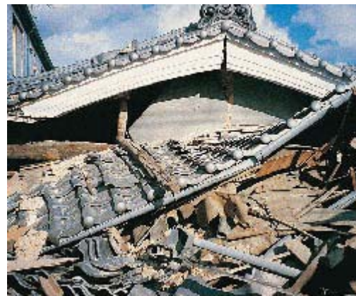
ТРАДИЦИОННЫЕ ЧЕРЕПИЧНЫЕ КРЫШИ (БЕТОН, ГЛИНА) ТЯЖЕЛЫЕ В ВЕСЕ И НЕИЗБЕЖНО ВЫЗЫВАЮТ СТРУКТУРНЫЕ ПОВРЕЖДЕНИЯ ВО ВРЕМЯ ЗЕМЛЕТРЯСЕНИЙ

ложенных решений было заменить широко распространенное использование тяжелой бетонной и керамической черепицы легковесными кровельными материалами, такими как кровля Gerard (Джерард), которая более надежна при землетрясениях и требует более легкую структуру поддержки (опору). Помимо этого, они выносили при различных погодных условиях и пожаре.