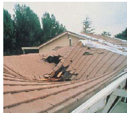
ЦЕМЕНТАЯ ЧЕРЕПИЦА СМЕСТИЛАСЬ, ЧЕМ ВЫЗВАЛА ПОВРЕЖДЕНИЕ СТРУКТУРЫ ДОМА

Дома с такими кровлями не имели структурных или кровельных повреждений, даже если они были расположены непосредственно в зоне значительных разрушений по соседству с сильно пострадавшими домами.