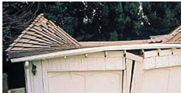
Снимки сделаны после сильного землетрясения в Northridge, Калифорния 1994 г. Фото тяжелой крыши (справа) и легкой металлической кровли Gerard (слева) были сделаны на одной улице