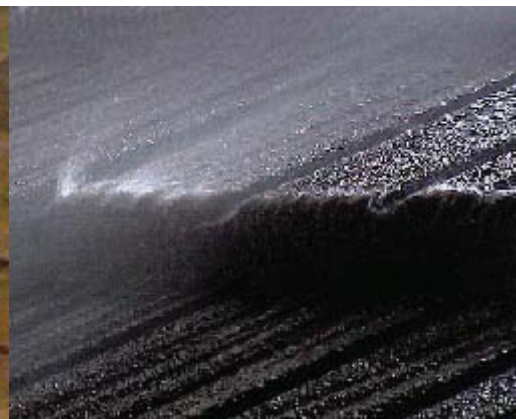
КОМПОЗИТНАЯ ЧЕРЕПИЦА GERARD

Композитная черепица Gerard, поставляемая в Украину, производится на новом современном технологическом комплексе Gerard (Венгрия), который отвечает самым высоким мировым стандартам.