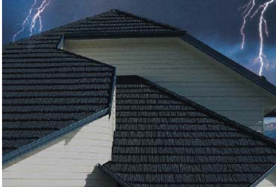
ХОРОШО ЗАЗЕМЛЕННЫЕ ДОМА НЕ БУДУТ ПОВРЕЖДЕННЫ ПРИ ПРОХОЖДЕНИИ МОЛНИИ.

Около 20% молний в Северной Америке (известны как вертикальные молнии) - это молнии, которые достигают земли. Наиболее вероятными мишенями для вертикальных молний становятся самые высокие объекты в районе, такие как деревья, электрические столбы, пилоны, заборы, антенны, видные холмы, здания и дома. Если здание (дом) является самым высоким объектом в районе, то вероятной мишенью станет наивысшая точка здания (дома). К примеру, трубы, телевизионные антенны или громоотводы. Прохождению молнии на землю будут сопутствовать кратчайшие пути проведения, которые могут стать надлежащими молниеотводами, - мокрая стена или край здания(дома). Хорошо заземленные дома не будут повреждены при прохождении молнии. Заземление необходимо с целью обеспечения безопасности. Тем не менее, для домов с деревянной или соломенной крышей присутствует особый риск пожара, если только дома не защищены молниеотводом.