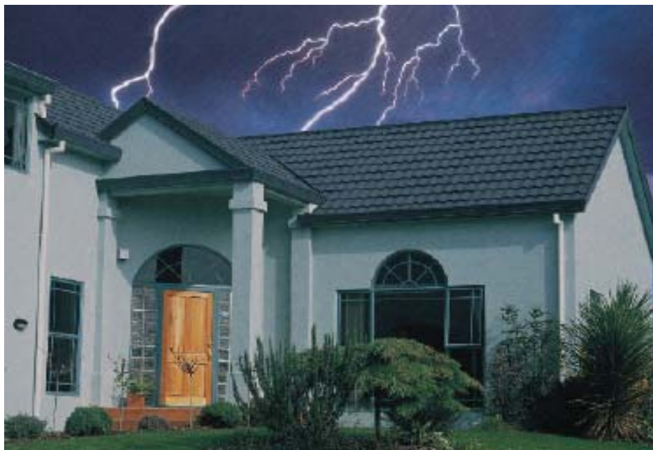
МЕТАЛЛОЧЕРЕПИЦА НЕ ДЕЛАЕТ ДОМ БОЛЕЕ УЯЗВИМЫМ К УДАРАМ МОЛНИИ, ЧЕМ НЕМЕТАЛЛИЧЕСКИЕ ПОКРЫТИЯ

Черепица, в основе которой лежит металл, распространена и по сей день и является частым выбором для промышленных и коммерческих зданий. Эта тенденция в выборе металлочерепицы не делает дом или здание более уязвимым к ударам молнии, чем, к примеру, битумная черепица (или любые неметаллические покрытия).