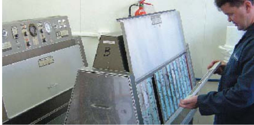
ИСПЫТАТЕЛЬНАЯ СТАНЦИЯ ANI ROOFING ПО УФ ОБЛУЧЕНИЮ

Простое соотношение с естественными погодными условиями приравнивает эти 5000 часов испытания к десяти годам пребывания кровли на открытом воздухе в различных климатических условиях.